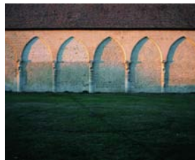
Grange à dîmes