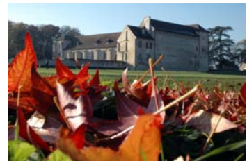
Salles abbatiales et bâtiment des latrines