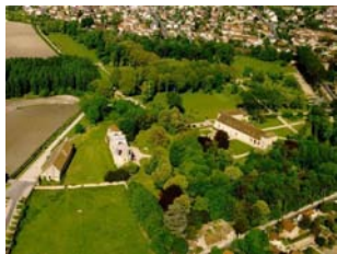
Vue aérienne de l'abbaye

Le site abrite deux services départementaux : le service de l'abbaye, chargé de la mise en œuvre du projet artistique et culturel, et le service départemental d'archéologie.