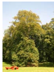
Vue du parc de l'abbaye